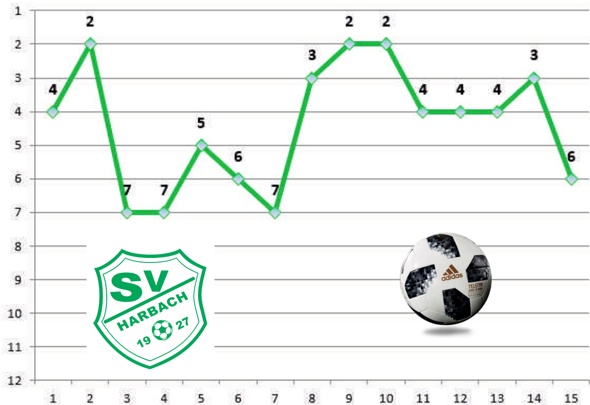
Platzierungen 2. Mannschaft