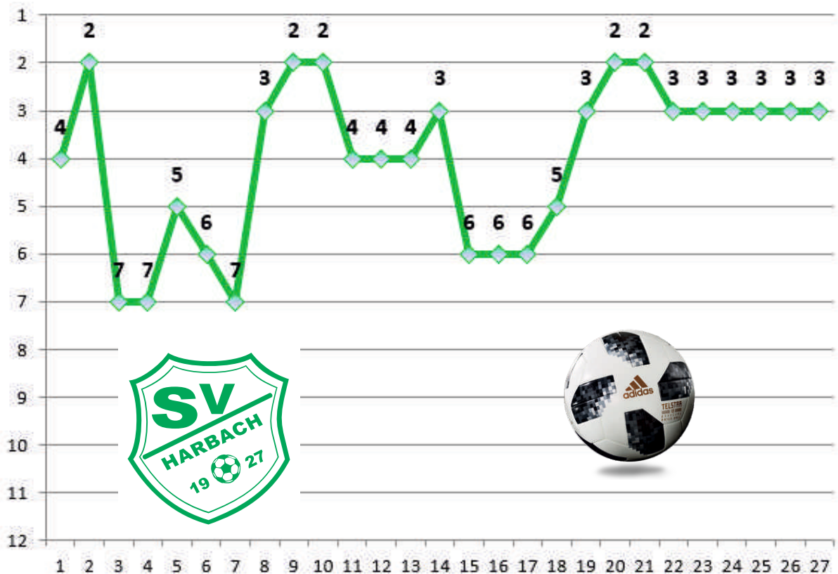
Platzierungen 2. Mannschaft